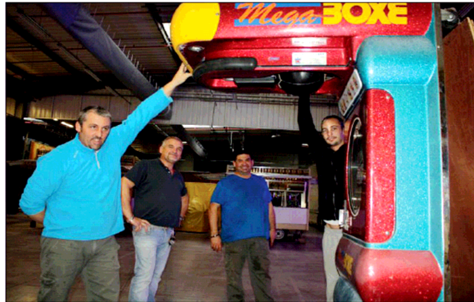
■ Les forains ont commencé à installer les manèges mardi. Samedi, la fête d'hiver battra son plein.

De telles fêtes couvertes ont lieu à Besançon, Saint-Etienne, Lyon, Villefranche-sur-Saône... Avec le parc